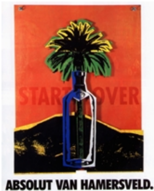
ABSOLUT VODKA Collage.