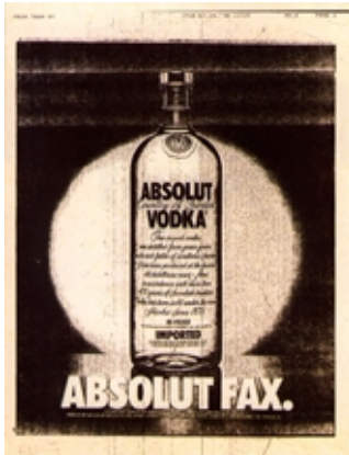
ABSOLUT VODKA Reproducción de fotografía pasada por fax.