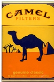
CAMEL Serie Genuine Planos

“La pintura puede exponer todo el contenido de la obra en un mismo segundo, (...) se nutre casi íntegramente de formas prestadas a la naturaleza. Su labor debe estar centrada en analizar sus materiales y potencialidades, conocerlos bien, (...) y utilizarlos en el desarrollo creativo de una manera exclusivamente pictórica.” (“Sobre lo espiritual en el arte” - Vassily Kandinsky - 1910)