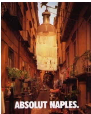
ABSOLUT VODKA Fotografía.

Las diferentes formas en que se puede presentar un imagen resultante de cualquiera de estas experiencias, pueden ser denominadas bajo el nombre de Modos de Representación .