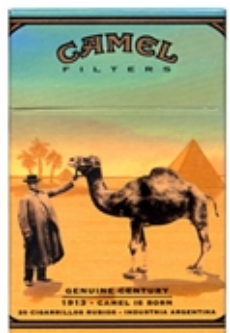
CAMEL Serie Century Dibujo y Fotografía.

Las formas de procesar imágenes, están totalmente ligadas a la creatividad y a la experimentación con cada método. Resultando de esto una ilimitada cantidad de combinaciones y resultados.