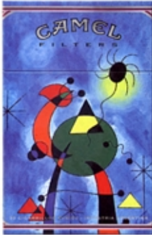
CAMEL Serie Art Pictórico - Miró.