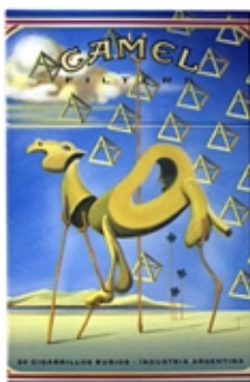
CAMEL Serie Art Pictórico - Dalí.

Esto suele ser interesante como método para empezar a plantear el diseño de una pieza, generando, en primera instancia, entre nosotros y lo que necesitamos comunicar, un relación más directa, no tan intelectualizada. Es una buena forma de generar material, y después con una mirada de diseñadores, rescatar lo que sirve.