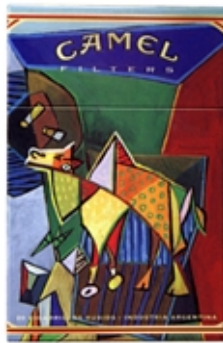
CAMEL Serie Art Pictórico - Picasso.