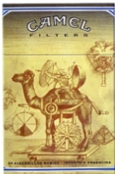
CAMEL Serie Art Pictórico - Da Vinci.

El objetivo buscado con la experimentación de este tipo de técnica es involucrarnos con el trabajo de una forma lúdica, que nos permite a nosotros mismos, introducirnos en la temática desde el plano de las sensaciones que nos provocan los materiales.