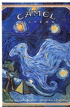
CAMEL Serie Art Pictórico - Van Gogh.