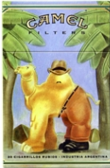
CAMEL Serie Art Pictórico - Botero.

En el momento de seleccionar el material a utilizar podemos tener en cuenta la posibilidad de reciclar material, es decir, tomar material ya existente y operar sobre él para reforzar o cambiar el mensaje, que se intenta transmitir. Es el fundamento del collage.