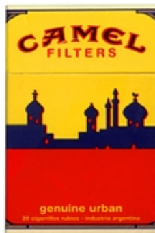
CAMEL Serie Genuine Planos