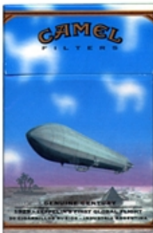
CAMEL Serie Century Ilustración / Retoque Fotográfico.