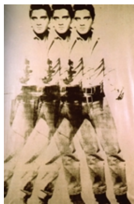
ANDY WARHOL Serigrafía