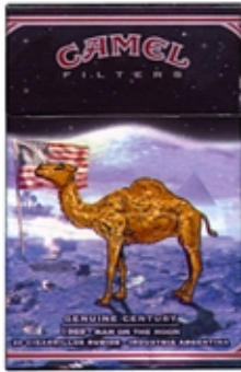
CAMEL Serie Century Ilustración