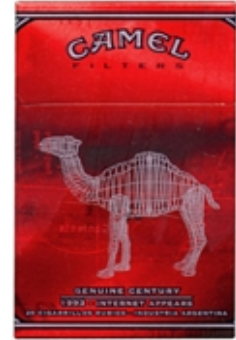
CAMEL Serie Century Ilustración digital