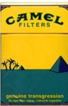
CAMEL Serie Genuine Planos