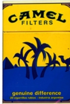
CAMEL Serie Genuine Planos