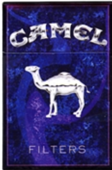
CAMEL Efecto Digital KPT Photoshop